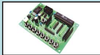
AVRマイコン トレーニングボード